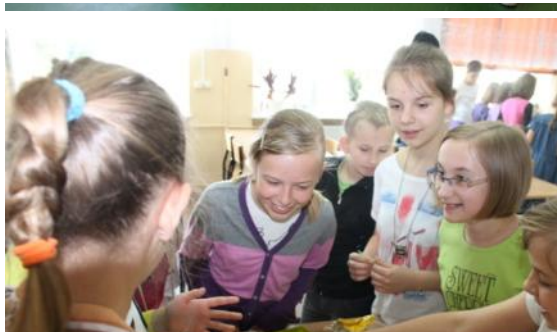
Klasy IV-VI walczyły w kuchennych rewolucjach sałatkowych.