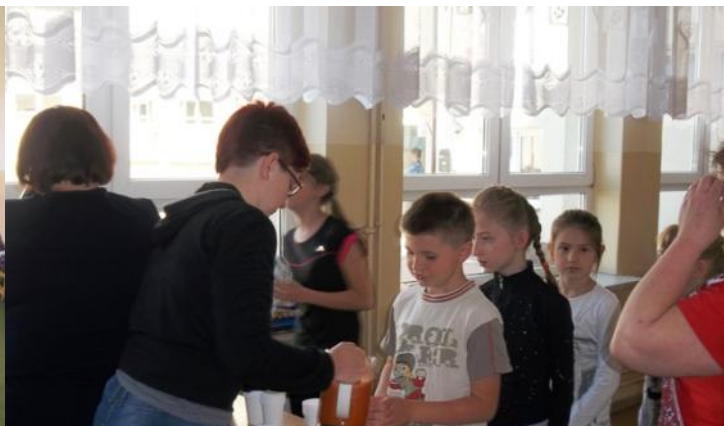
Rada Rodziców zadbała, aby każdy uczeń mógł wypić szklanekę soku wyciśnię-