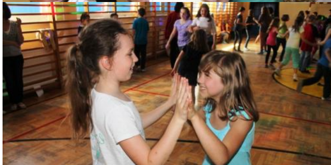
Cały dzień zakończył się dyskoteką na dużej Sali gimnastycznej