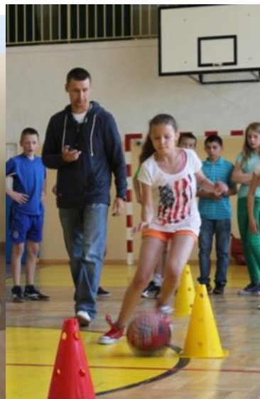
Uczniowie mieli okazję zmierzyć się w różnych konkurencjach sportowych i wygrać medal.