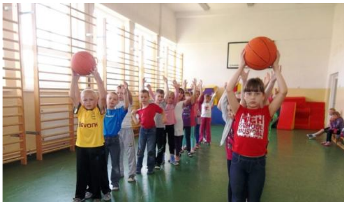
Klasy I-III rywalizowały w konkurencjach sportowych na małej Sali gimnastycznej.